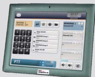
Touch Panel PC 8 Zoll/Intel N270/ mit Microsoft® XP Embedded